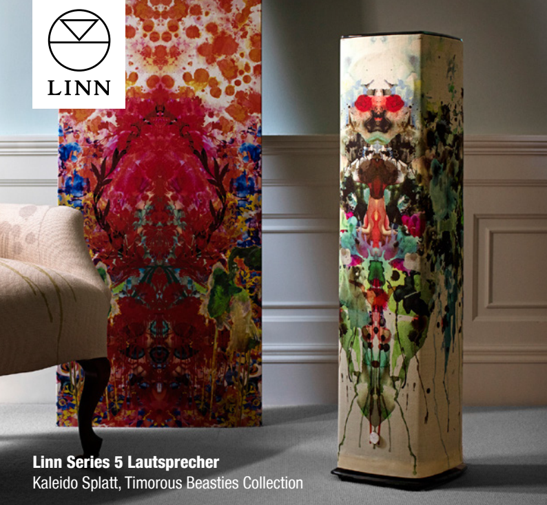
Linn Series 5 Lautsprecher Kaleido Splatt, Timorous Beasties Collection